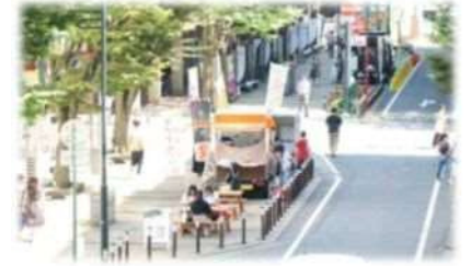
歩いて楽しいまちながづくりの推進