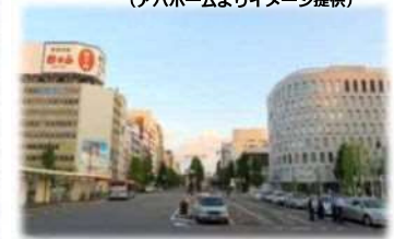
都市再生緊急整備地域の指定の実現