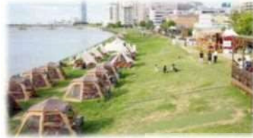
河川空間の有効活用