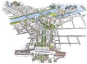
新潟都心の都市デザインの推進