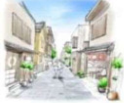
古町地区将来ビジョンの具現化