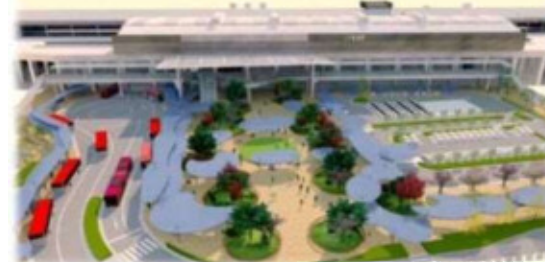
(仮称) 新潟駅万代広場の整備