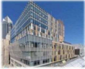
市街地再開発事業（古町ルフル）

新潟駅から古町までは、ほぼ2 km この2 kmから始まる周辺エリアが、「新潟の顔」、活気感じるエリア これから先も、わくわくドキドキする「にいがた2 km」に注目！！