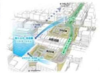
(仮称) バスタ新潟の整備