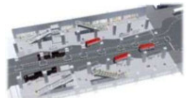
新潟駅直下バスターミナルの整備