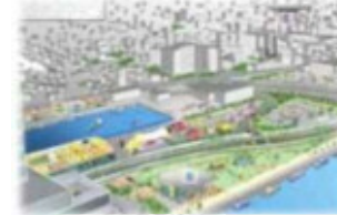
万代島地区将来ビジョンの具現化