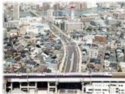
新潟市街地の活性化