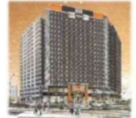
大規模ホテル、マンション開発