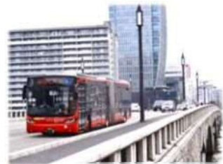
持続可能な公共交通の実現