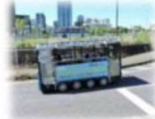
賑わい創出に向けた社会実験