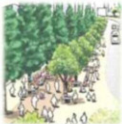
川のまちなか空間の創造