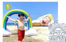
日如山浜魅力創出事業