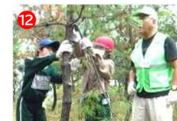
地域と小学生の協働での枝切り体験