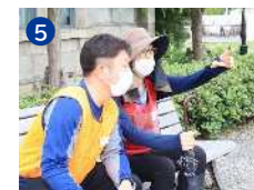
地域でのはいかい模擬訓練