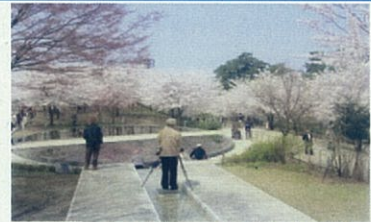
空中庭園・浮島カスケード

また、空中庭園の下にある白山公園駐車場は、公園利用者や公園内施設の利用者、新潟市役所駐車場補完機能、さらに白山神社の利用者などの利便性向上の重要な役割を果たしています。