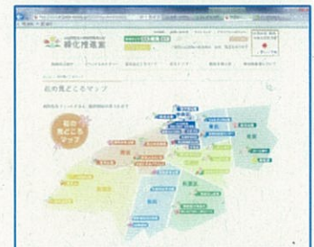
花の見どころマップ (HP)