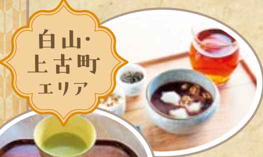
白山・ 上古町 エリア