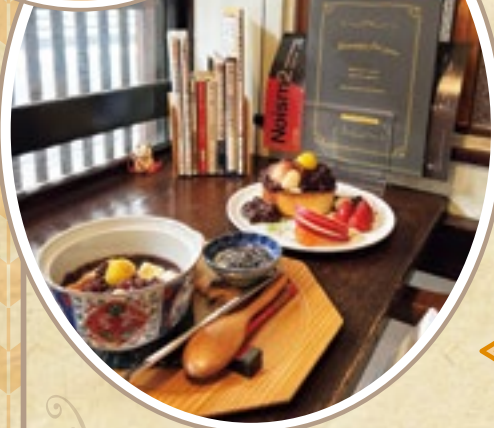
沼垂・ 新潟駅周辺 エリア