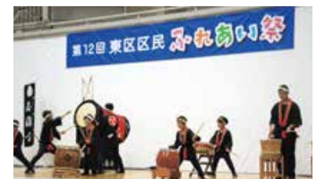
昨年のステージ発表