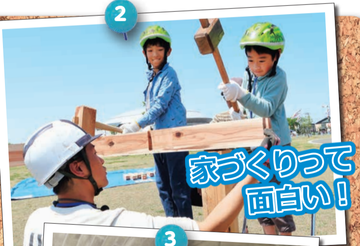
家づくりって 面白い!