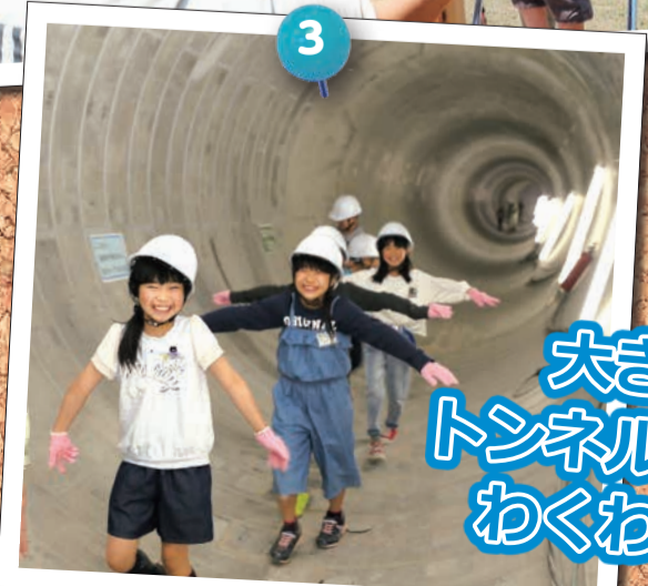
大きな トンネルに わくわく

① 4月26日から5月26日まで、寺山公園でこいのぼりを掲揚する『寺山こい来いフェスタ』が行われました。イベント初日に子育て交流施設「い〜てらす」で行われたオープニングイベントでは、県立幼稚園、牡丹山幼稚園、上木戸保育園の園児が合唱を披露しました。