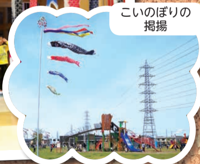
こいのぼりの 掲揚