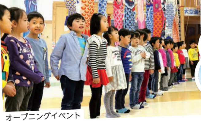
オープニングイベント