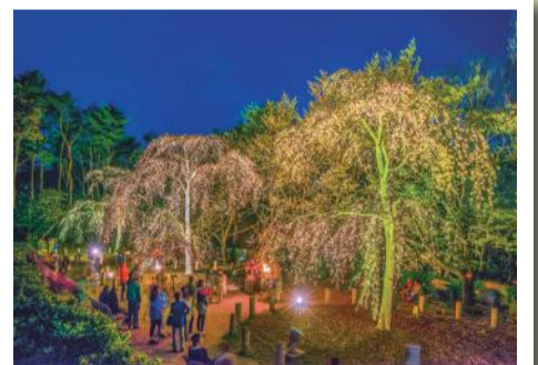
「ライトアップ」 川崎 耕輔