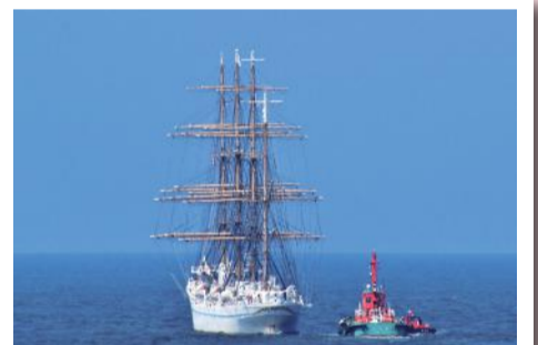
「See you again」 二瓶 純緒