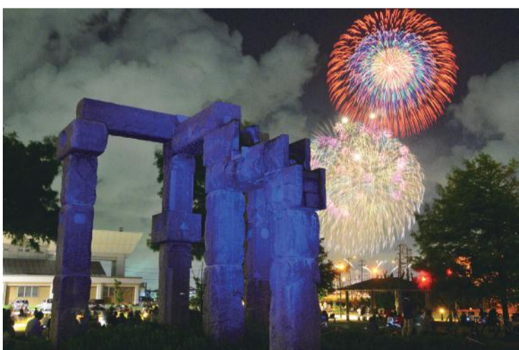
「神殿とござれや花火」 石津 不二男