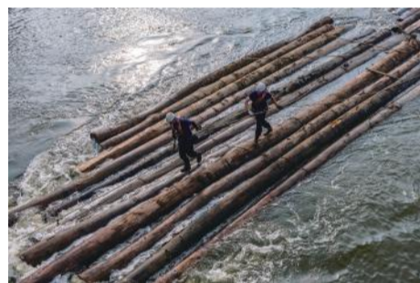
「筏流し」 上杉 正春