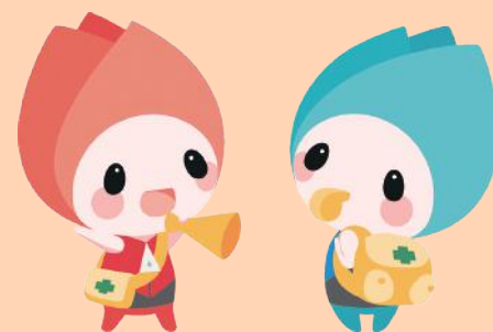
新潟市防災マスコットキャラクター ジージョ・キョージョ