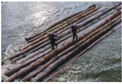
「筏流し」 上杉 正春