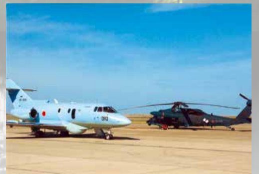
航空自衛隊新潟分屯基地