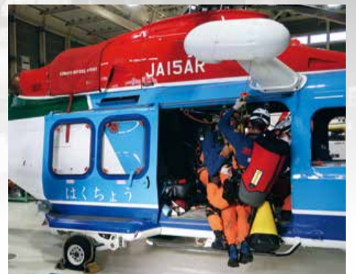
新潟県消防防災航空隊