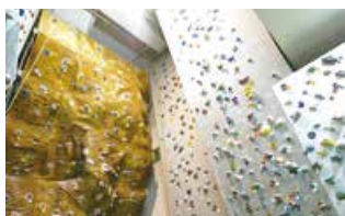
クライミングルーム (東総合スポーツセンター)

問い合わせ 地域課産業文化振興室(☎025-250-2130) 東総合スポーツセンター(☎025-272-5150) 下山スポーツセンター(☎025-272-7677)