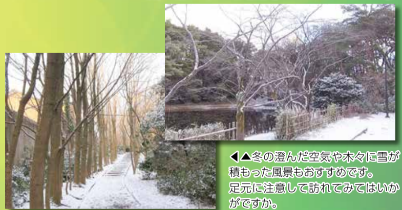
◀▲冬の澄んだ空気や木々に雪が積もった風景もおおすすめです。足元に注意して訪れてみてはいかがでしょうか。