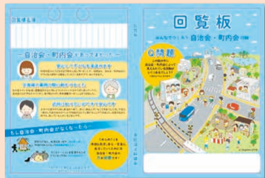
▲回覧板(バインダー)は、希望があった自治会・町内会へ配布する予定です

自治会・町内会長の皆さまにインタビューなどにご協力いただき、具体的でわかりやすい事例を掲載しています。どうぞご期待ください!