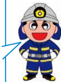
新潟市消防局 マスコット キャラクター 消太くん