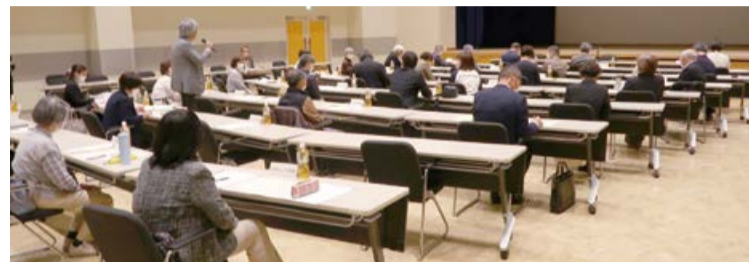
令和5年度 東区自治協議会 全体会議の様子