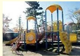
うしかいどう 牛海道中央公園