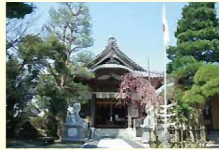
ひむすび 寺山不動尊火産霊神社

明治40年、山木戸地域にあった三社を統合。三体の祭神が合祀されており、祭りでは神楽が奉納されます。