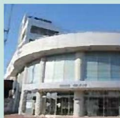
南口エントランス

区役所のほか、「東区プラザ」、子育て支援施設「わいわいひろば」、図書室などを併設しています。飲食可能なフリースペースや飲食店もあります。