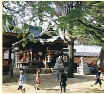
みほしら 三柱神社

学業、商売の神々を祀る神社。春・秋の祭りでは町内別の「山の下の木遣り」が奉納されます。