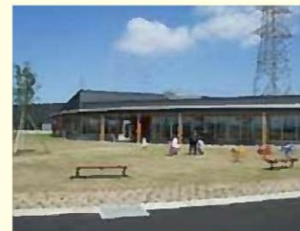
寺山公園・子育て交流施設「い〜てらす」

中学生までの子どもが遊べる施設。春には満開の桜が、お城がモチーフになった建物を囲みます。