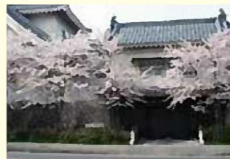
子ども創作活動館

周囲を木々で囲まれており、夏には森林浴、秋にはどんぐりやまつぼっくり拾いなど季節を感じながら遊ぶことができます。