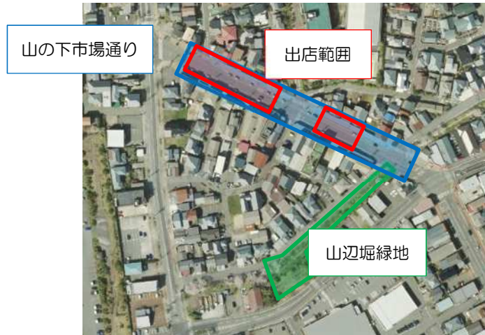
出店ブースの配置イメージ (10 区画)