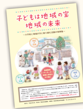
「子どもは地域の宝 地域の未来～小学校と地域が共に取り組む活動の事例集～」

今年度は、東区の魅力を広く周知するために、地域を紹介する「デジタル紙芝居制作事業」を行います。制作にあたっては、昔からある歴史的なものやハード面だけでなく、最近できたものや魅力的な事業などのソフト面も紹介し、未来に向かって発展しようとする営みや人々の笑顔があふれる映像を大切にしていきたいと思っています。