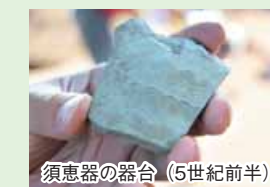
須恵器の器台（5世紀前半）

このように東地区は、新しいものと歴史あるものが共存し、さまざまな魅力があります。（荒木美穂子）