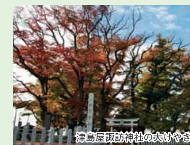
津島屋諏訪神社の大げやき

また、主な文化財として、約200年前から続く大形神社の太々神楽や、津島屋諏訪神社の大げやきなどがあります。さらに、平成26年9月に