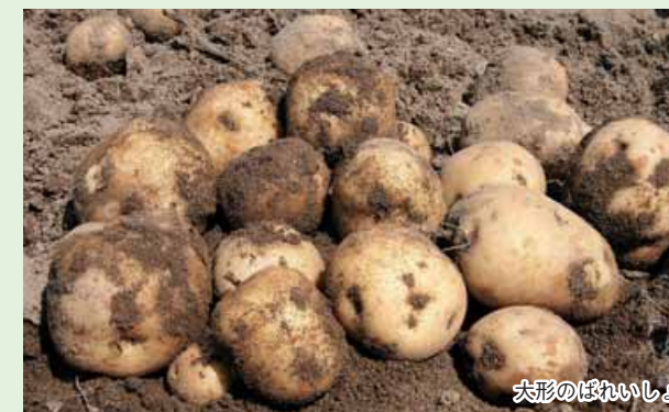
大形のばれいしょ