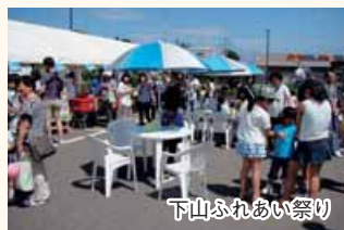
下山ふれあい祭り

当コミュニティ協議会は、自治会をはじめ地域に根ざした多くのボランティアグループ等これまで活動してきた組織、団体から構成されています。それぞれの活動を尊重しながらお互いに協力し、より良い地域づくりに努めています。