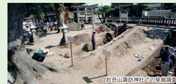
牡丹山諏訪神社での発掘調査