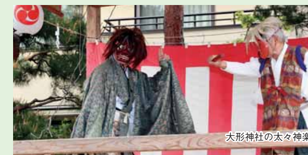
大形神社の太々神楽

そのように開発が進む東地区ですが、新潟県内で出荷量が1番の大形のばれいしょ、竹尾の切り花など農業も盛んです。また、珍しいミズアオイが大形地区で見つかり、地元の方によって保護活動が行われています。夏から秋にかけて、青紫色の可愛い花が見られます。