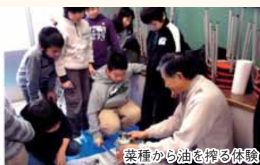
菜種から油を搾る体験

地域と小学生との共同作業により、交流が深まるとともに、地域の子どもは地域で育てるという考えのもと取り組んでいます。