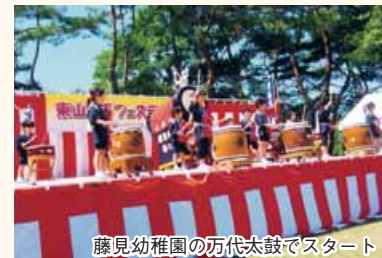
藤見幼稚園の万代太鼓でスタート

当コミュニティ協議会は、福祉活動にも力を入れています。ふれあい給食には8会場600人が参加し、福祉ボランティア「じゅんさいの会」による小さな困りごとの助け合いが、多くの自治会に広がっています。