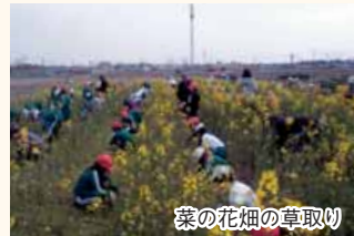
菜の花畑の草取り

当コミュニティ協議会では、新潟市が地球温暖化対策の一環で実施している「にいがた菜の花プラン」を、平成19年度から市民参加の協働モデル事業として実施しています。当コミ協と南中野山小学校が一緒になって取り組み、平成20年9月から種まきを行いました。今年で9年目になります。