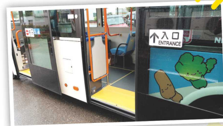
新しい車両の乗降口