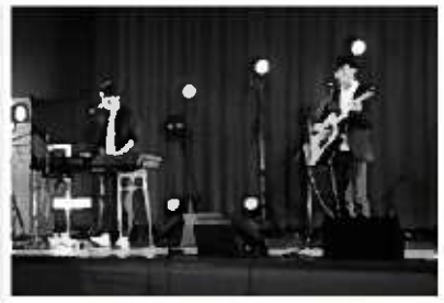
『アコースティックサークル』

私たちは、ピアノやギターなど、電気を使わない楽器を用いた音楽パフォーマンスをお届けするサークルです。昔ながらのフォークソングから、最近のポップな曲まで、幅広いパフォーマンスで、皆さまの心温まるような時間を提供します。