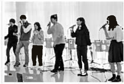
『アカペラサークル mash#POTATO』

私たちは、ピアノやギターなど、電気を使わない楽器を用いた音楽パフォーマンスをお届けするサークルです。昔ながらのフォークソングから、最近のポップな曲まで、幅広いパフォーマンスで、皆さまの心温まるような時間を提供します。