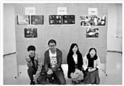
『写真サークル swich(スイッチ)』

私たちは、新潟市学生写真部連盟展や学園祭での写真の展示を主な活動としています。他にも、撮影会やカレンダーの作成など楽しく活動しています。お互いに刺激を受けあいながら作った作品を楽しんでいただければ幸いです。