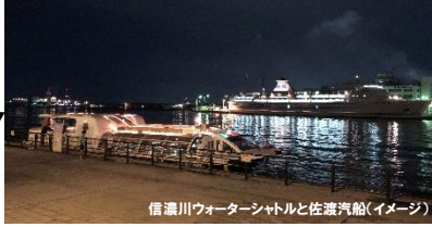
信濃川ウォーターシャトルと佐渡汽船(イメージ)

新潟駅南口(15:10)－東区役所(15:30/15:50)－ ㈱博進堂 ▼(工場見学)－ 信濃川ウォーターシャトル朱鷺メッセ乗り場 (夕日沖合クルーズ・弁当夕食)～ みなとぴあ芝生公園 ▼(佐渡汽船の船舶回頭見学)－通船川鷗橋付近▼(工場夜景見学)－東区役所(20:50)－新潟駅南口(21:10) □□弁