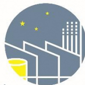
新潟東区工場夜景 NIGHT VIEW OF THE FACTORY ZONE