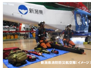
新潟県消防防災航空隊(イメージ)

新潟駅南口(15:00)ー東区役所(15:20/15:40)ー新潟県消防防災航空隊▼(ヘリコプターを見学)ー新潟空港(レストランにて夕食後、展望デッキやPRルームを見学)ーあかしあ公園▼(新潟空港に発着する飛行機を見学)ー東北電力(株)新潟火力発電所▼(東区桃山町の発電施設見学と夜景見学)ー通船川鷗橋付近▼(工場夜景見学)ー東区役所(21:10)ー新潟駅南口(21:30) □□夕