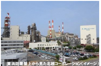
東消防署屋上から見た北越コーポレーション(イメージ)

新潟駅南口(14:10)－東区役所(14:30/14:50)－ 東消防署 ▼(施設見学)－ 北越コーポレーション (株)▼(工場見学)－ ナチュラルレストランSUZU8 (夕食)－通船川鷗橋付近▼(工場夜景見学)－東区役所(19:50)－新潟駅南口(20:10) □□夕