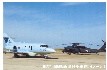
航空自衛隊新潟分屯基地(イメージ)

新潟駅南口(15:00)ー東区役所(15:20/15:40)ー航空自衛隊新潟分屯基地▼(基地見学)ー和の匠 みやむら(夕食)ーあかしあ公園▼(新潟空港に発着する飛行機を見学)ー東北電力(株)新潟火力発電所▼(東区桃山町の発電施設見学と夜景見学)ー通船川鷗橋付近▼(工場夜景見学)ー東区役所(21:10)ー新潟駅南口(21:30) □□夕