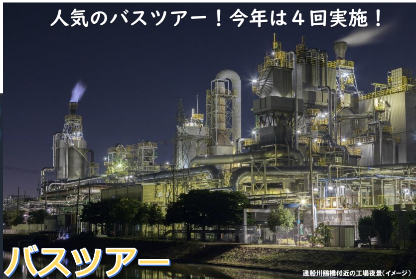
通船川鷗橋付近の工場夜景(イメージ)

！ ご確認ください 裏面にツアー参加の注意事項を記載しております。必ずご確認の上、お申し込みください。