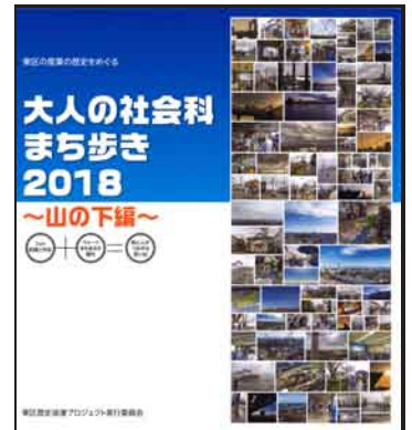
完成イメージ(2018年版)

後日、自分が撮影した写真を使って、みんなでつくるアルバムの1ページを制作します。さらに、撮影写真を展示する写真展も開催します。