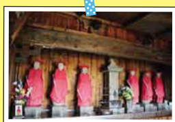
ろくたいじぞうそん 六體地藏尊