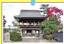
しょうだいじ 照大寺