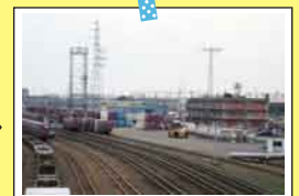
新潟貨物 ターミナル駅