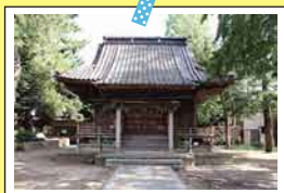
いしやますわじんじゃ 石山諏訪神社