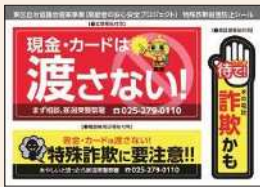
啓発活動の様子(左) 特殊詐欺被害防止シール(右)

特殊詐欺の情報は、すでに多くの人が心得ており、自分は「そのような車には乗らない」と思っている人でも被害に遭っている現状があります。