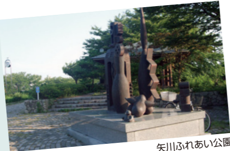
矢川ふれあい公園

矢川ふれあい公園で四季を伝える角田弥彦の山脈を眺めながら、坂道、階段を使って足腰を鍛えましょう。トイレ、公園照明灯、水場が完備しており、安全安心なコースです。