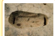
⑥ 方形周溝墓の埋葬施設 埋葬施設には鹿角製の柄で飾った鉄剣とヤジリがそえられていました。戦士でもあったムラ長の墓と考えられます。