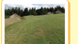
② 内環濠A・B 環濠の内側にある濠で、総延長80mあります。この濠で囲まれた部分は、遺跡の中心となる特別な範囲で、ムラ長一族の居住区と考えられます。