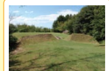
③ 条溝1 ④ 条溝2 幅3.5m、深さ2mもあり最も規模の大きな条溝です。彩色部分が濠の中に埋まった土壁です。北地区と南地区を分ける条溝1、南地区を東西に分ける条溝2が見つかっています。