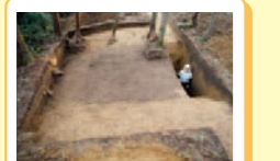
③ 条溝1 幅3.5m、深さ2mもあり最も規模の大きな条溝です。彩色部分が濠の中に埋まった土壁です。北地区と南地区を分ける条溝1、南地区を東西に分ける条溝2が見つかっています。