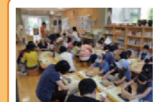
体験学習 予約がして、子供から大人まで様々な体験ができます。体験メニューは月替わりです。なお、10名以上の団体の場合は事前の申し込みが必要です。