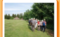
イベント 弥生時代の技術や生活体験に関するイベントを開催しています。詳細はパンフレット・ホームページ等でご案内しています。