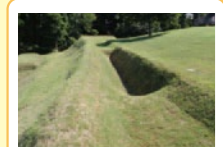
① 外環濠C 環濠は幅2m、深さ2mほどで、外側に土壁が築かれています。環濠の中に入って深さを体感できません。

南地区は南北方向の瘦せ根根に掘られた条溝1によって北地区と分けられています。東西方向にのびた南地区は中ほどにある条溝2によって東西に分かれています。10数棟の竪穴住居が見つかっています。