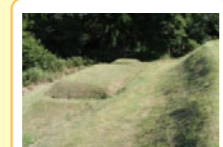
⑤ 方形周溝墓 溝で囲まれた2基の四角い墓です。外環濠の内側に作る際、ムラにとって大切な人が葬られたようです。ムラの共同墓地が見つかっていません。

文様のない①北陸系、文様・縄文のある②東北系、両方の要素をわせ持った③地元系（八幡山式）の土器が作られました。