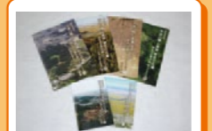
ガイドブック 来館者には、古津八幡山遺跡のことを分かり易くまとめたガイドブック№1～6を差し上げています。