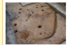
竪穴住居の構造 隅の丸い四角形で1辺の長さは4～5mです。4本の柱を持ち、中央には調理や暖をとる炉があります。壁際には物を蓄える穴があります。