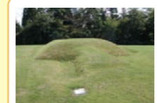
⑦ 前方後方形周溝墓 遺跡の最も高い場所から1基だけ見つかった墓です。四角形の墓へ上る通路がスロープ状に盛土され、大小の四角がくっついた形に見えます。