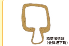
⑧ 会津にある前方後方形周溝墓のルーツ 会津にある前方後方形周溝墓は、北陸から古津八幡山遺跡を経由して伝わったもので、同様な形の墳墓は東海・北陸・会津などに多く見られます。