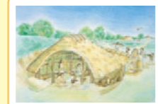
竪穴住居復元イラスト 地面を掘り下げて造る竪穴式です。周辺から水が流れ込まないように、掘った土を周りに盛り込み、外側には溝を掘っています。