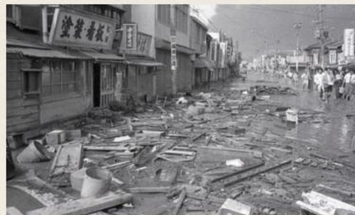
水が引き切らずに残った泥水と残骸 (中央区横七番町通1付近)