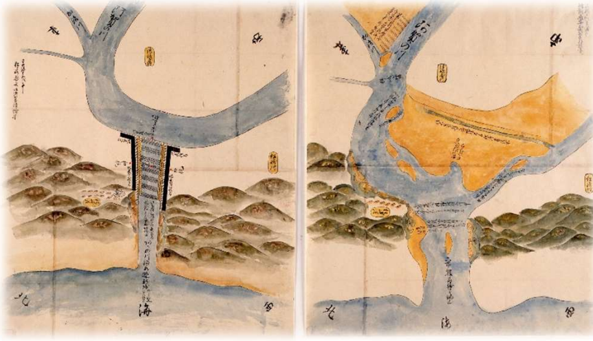
松ヶ崎悪水御普請絵図(左) 松ヶ崎悪水御普請絵図 所段々川欠成り(右)