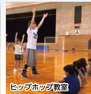
ヒップホップ教室