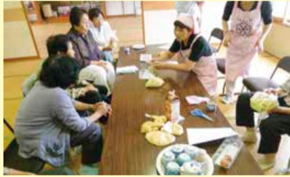
上黒山四地区ふれあい会館でパッククッキング講習会