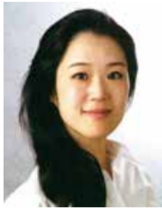
円地 晶子 Akiko Enji