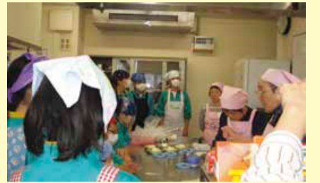
松浜中学校でパッククッキング講座