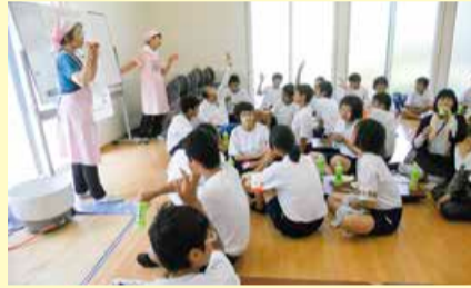
光晴中学校地域貢献活動でミニ講話とカレー作り