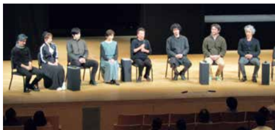
昨年上演「野鴨」のアフタートークの様子