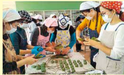
早通南小学校で団子づくり