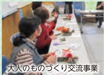
大人のものづくり交流事業