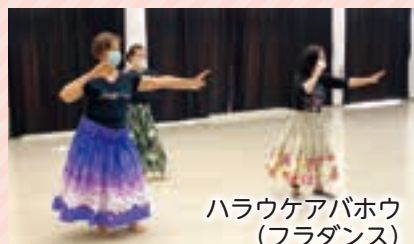
ハラウケアバホウ (フラダンス)

・フォークダンス ・フラダンス ・フラワーアレンジメント ・社交ダンス ・健康体操 ・絵手紙 ・空手 ・太極拳 ・登山 ・俳句 ・川柳 ・絵画