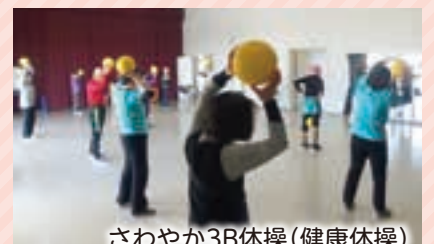
さわやか3B体操(健康体操)