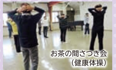
お茶の間さつき会 (健康体操)