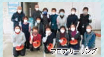
フロアカーリング