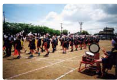
岡方第二小学校 高森いざや神楽