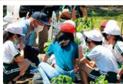
南浜小学校 南浜農園 縦割り班で野菜の栽培