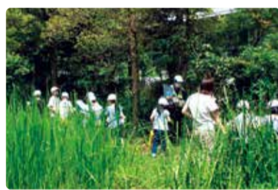
葛塚小学校 ビオトープでの生き物観察