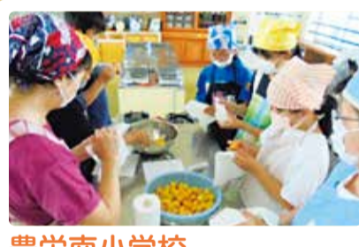
豊栄南小学校 「豊南おいしいもの」作り (梅みそ・梅干し・梅ジュース作り・打ち豆)