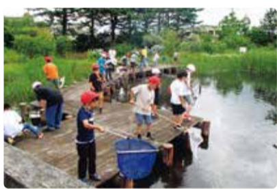
濁川小学校 調べよう私たちの町～トンボ池～