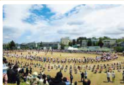
松浜小学校 運動会 生演奏で松浜盆踊り