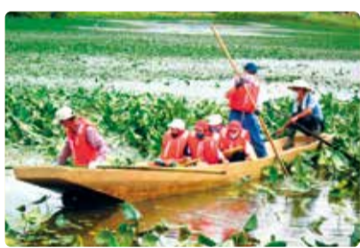
岡方第一小学校 未来に残そう!地域の宝 十二潟