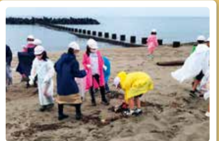
太夫浜小学校 ウミガメ復活プロジェクト海岸清掃