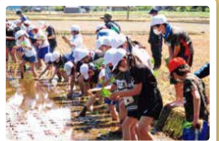
木崎小学校 米作り 田植え