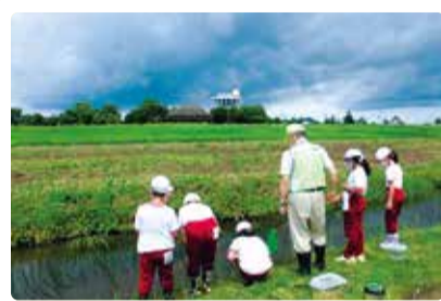
葛塚東小学校 すてき発見わたしのまち 福島潟でザリガニ釣り