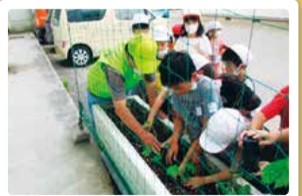
早通南小学校 緑のカーテン～ゴーヤを育てよう～