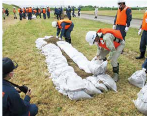
土のうを積み手順を確認