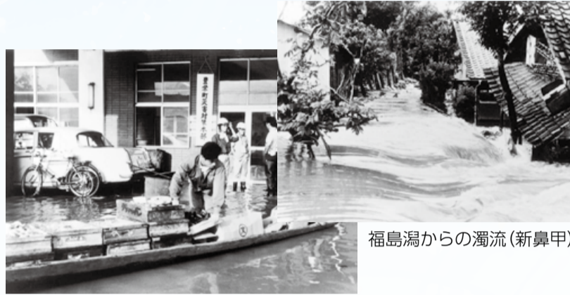
福島濁からの濁流(新鼻甲)

洪水は被害が広範囲に及ぶことが想定されます。日頃から、ご家庭でできる準備をしましょう。