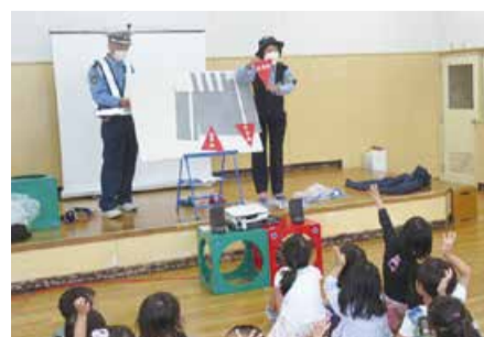
保育園の交通安全教室

謝礼 1回2時間以上の活動につき6,200円 申し込み 区民生活課生活環境係(☎387-1295)