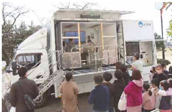
地震体験車で東日本大震災の揺れにびっくり