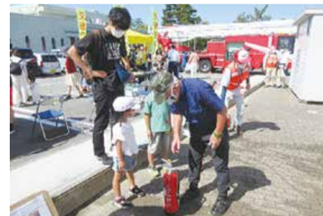
防災士が分かりやすく消火器の取り扱いを説明