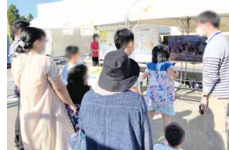
AR(拡張現実)で浸水リスクを体験