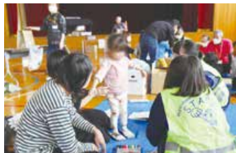
新聞紙がスリッパに変身?

「子どもが防災について学べる機会があり、ありがたかったです」(参加者) 「防災のことを学べたり、地域の人と交流することができたので良かったです」(中学生ボランティア)