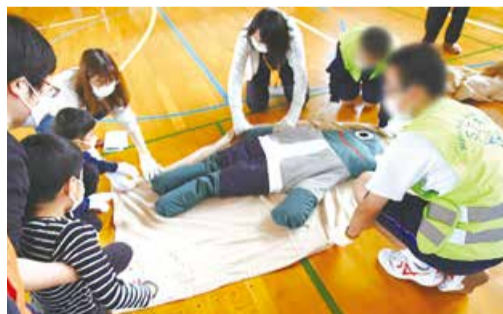
毛布を担架にして、カエル君を救出