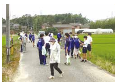
木崎中学校 地域クリーン作戦