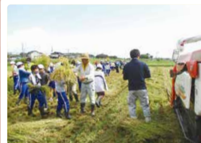
木崎小学校 学校田 稲刈り