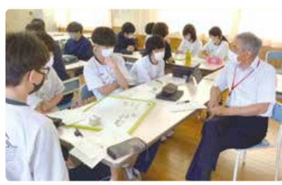
濁川中学校 濁川未来プロジェクト ～地域からグローバルな視野を広げます～