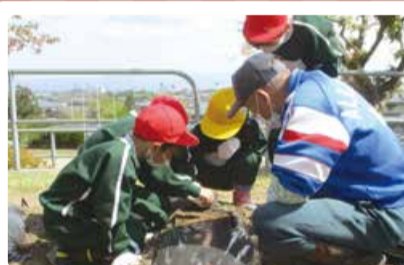
南浜小学校 「南浜農園活動」 春の種まき・苗植え