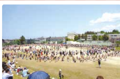
松浜小学校 地域みんなで踊ろう 松浜盆踊り