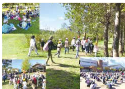
葛塚小学校 福島潟アドベンチャー