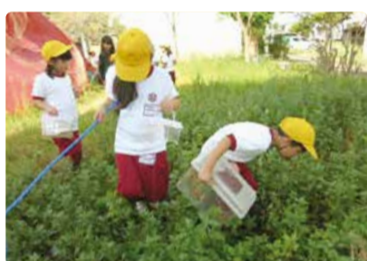
早通南小学校 1年生 町探検「公園探検」