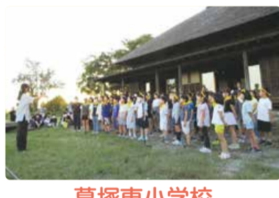
葛塚東小学校 福島潟自然文化祭 点灯式 合唱隊参加