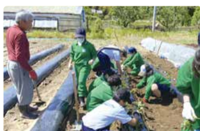
南浜中学校 夢・未来・南浜プロジェクト