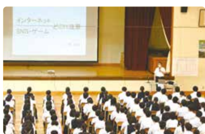
松浜中学校 ゲストティーチャー講座 「人権啓発講演会」