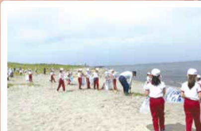
太夫浜小学校 ウミガメ復活プロジェクト海岸清掃