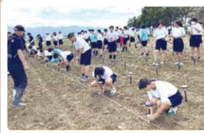
葛塚中学校 福島潟自然文化祭 「雁迎灯」LEDライト設置