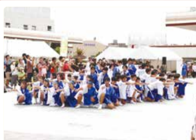
早通中学校 総踊り活動