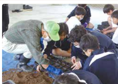
岡方中学校 岡方花の陣～咲き誇れ！地域の絆！！～