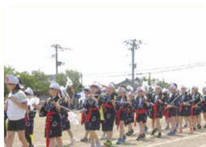
岡方第二小学校 高森いざや神楽