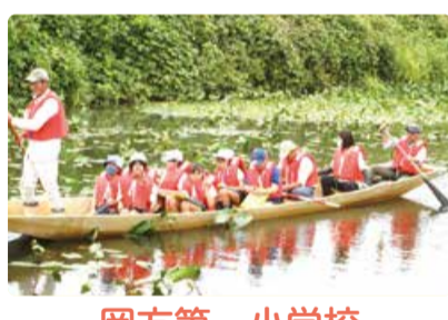
岡方第一小学校 未来に残そう！地域の宝 十二潟 ～十二潟観察会～