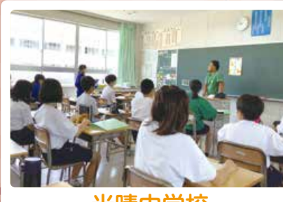
光晴中学校 職業講話 ～人生観や仕事への想いを さまざまな職業の方から聴く会～