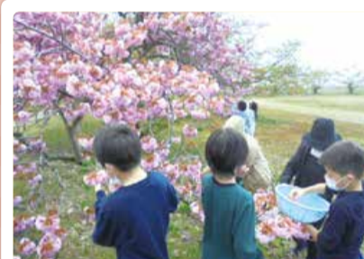
豊栄南小学校 「豊南のおいしいもの」桜茶作り