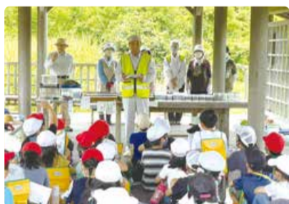
濁川小学校 調べよう私たちの町～トンボ池～