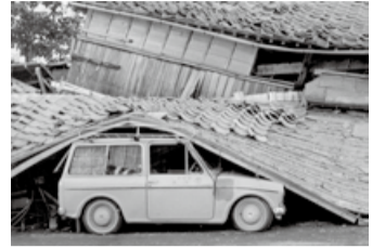
新潟地震被害(内島見)