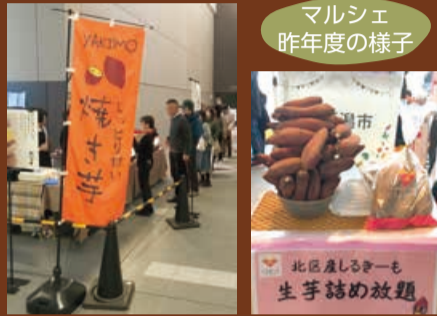
マルシェ 昨年度の様子