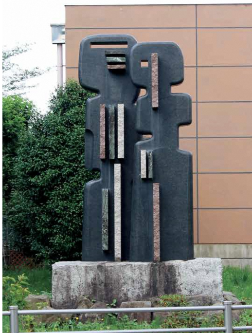
「希望に向かう人」1990年