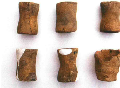
出山式製塩土器（東港亀塚遺跡より出土） 右下がコップ状土器、その他は器台

8世紀前半～10世紀後半の奈良・平安時代、食生活に欠かせない塩が北区でも作られていました。新潟東港の水路を掘ったときに発見された出山遺跡や東港亀塚遺跡からは、海水を煮つめて塩にするための専用の土器（製塩土器）が出土しました。鼓型の器台とコップ状の土器がセットで、他の地域では発見されていないタイプなので、「出山式製塩土器」と呼ばれています。