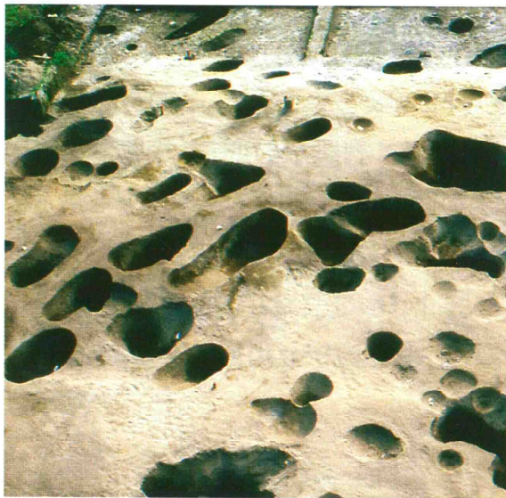
墓と考えられる楕円や円形の穴

海岸線から約6km、新砂丘I-4列上で、鳥屋集落南側の、現在、畑と水田が広がっているところに鳥屋遺跡があります。遺跡の範囲は東西約100m、南北約50mで縄文時代の遺跡としては、市内最大級です。過去に3回、発掘調査が行われ、約2,500年前の縄文時代晩期末の遺跡であることがわかりました。