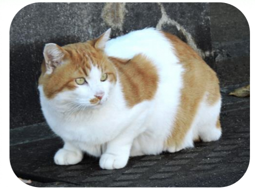
ココちゃん (男の子 7才)

木崎・早通・長浦の各コミュニティセンターにて、 プログラミング教室を月3回で開催中。 デジタルをもっと楽しく学んでみましょう!