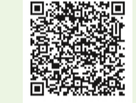
フェイスブックページ