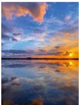
撮影場所：横越地区

田植え前の短い期間だけ見ることができる水鏡に映った夕焼けのリフレクションを捉えた一枚です。入賞作品は公式サイトで紹介しています。