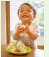
前回 野菜・果物部門 グランプリ 「枝豆 とうもろこし ほのり梅のおむすび」

新潟市産の美味しい農作物をもっと多くの人に食べてもらうために、料理や加工品の写真をFacebookで募集します。自慢の写真をどんどん応募してください。