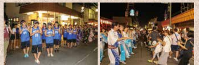
昨年の亀田甚句流しの様子

近年は小中学校の運動会で亀田甚句を踊ることもあり、子どもたちがたくさん祭りへ参加してくれるようになりました。踊りも年々上達しています。子どもたちが踊るのを見て自分も参加したくなったという方、一緒に輪に入って踊りませんか。亀田甚句を踊れる方も踊れない方も飛び入り参加大歓迎です。昔のように本町商店街の端から端まで、踊りの輪を広げましょう。