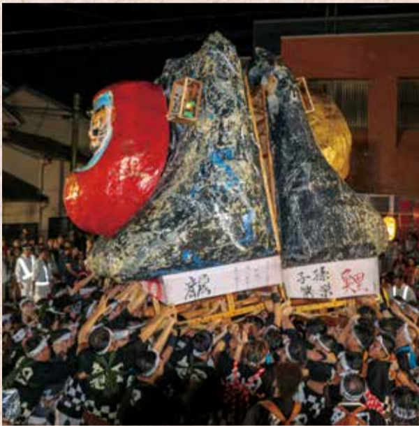
今年の本部前押し合いは1回です。

300年以上の歴史を背景に、軽やかな樽ばやしに合わせて踊る「甚句流し」、粋な亀田木遣り音頭に合わせて、高さ4メートルもの灯籠を激しく押し合う「大岩万燈押し合い」。熱く燃え上がる本町通りに皆さんどうぞお越しください。