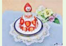
前回 江南区親善大使部門 グランプリ 「いちご農家のまなむすめ」

□応募方法 Facebookに投稿または、産業振興課へメール (Facebookの場合) Facebook「おいしいフォトコンテスト@江南区」ページにアクセスし、投稿欄から投稿 ※写真のタイトル・PRコメント(100字以内)及びハッシュタグ「#おいしい江南区」を記載