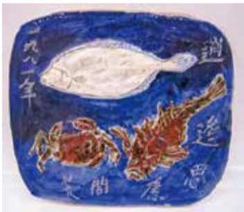
宮川寅雄「陶板 追逢思慮間」