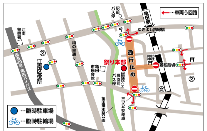
臨時駐車場から祭り本部まで徒歩約20分

8月25日(日)・26日(月) 午後6時～10時 ※路線バスは最終バスまでう回路で運行します