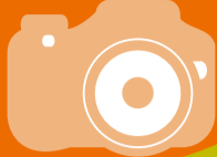
26日 亀田小学校・亀田西小学校 岩万燈押し合い