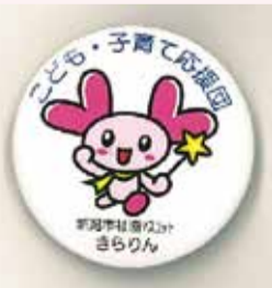
子ども・子育て応援団バッジ

地域での子育てをテーマにした「令和元年度 江南区民福祉大会」を開催します。 罫10月19日(土)午後1時~4時 罫江南区文化会館 音楽演劇ホール 囚基調講演「ななめの関係が人・まちを育てる~他育て、他孫(たまご)育てのすすめ~」、パネルディスカッション、ほか 囚先着70人 罫10月10日(木)までに、市役所コールセンターへ ☎025-243-4894 罫健康福祉課 地域福祉担当 ☎025-382-4346 ※詳しくは「区役所だより こうなん」9月15日号をご覧ください。