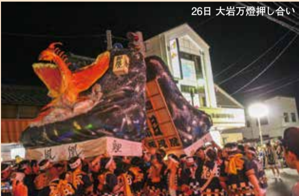
26日 大岩万燈押し合い