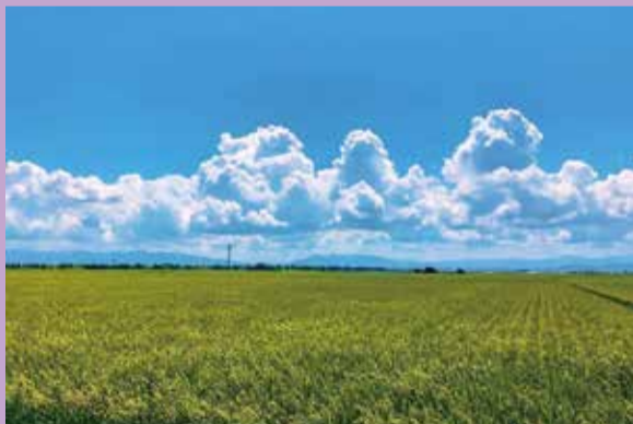
夏部門(撮影地：天野)