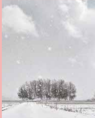
冬部門(撮影地：大淵の池)