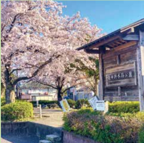
春部門 (撮影地：亀田排水路公園)