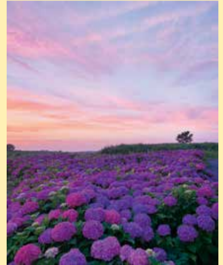
夏部門 (撮影地：阿賀野川フラワーライン)