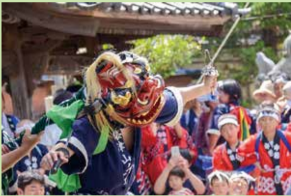
夏部門 (撮影地：伊夜日子神社 / 袋津まつり)