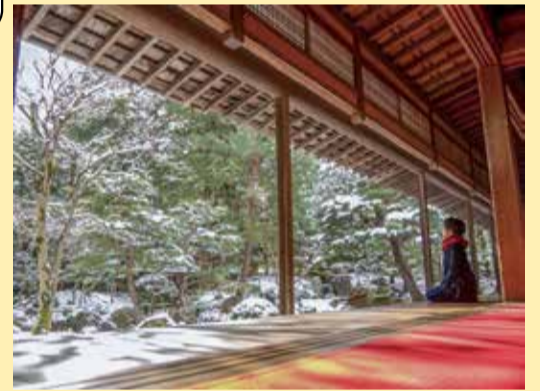
冬部門 (撮影地：北方文化博物館)

普段目にしていない何気ない景色が実は絶景なのかもしれない。この田園風景は新潟の誇りだぜ!