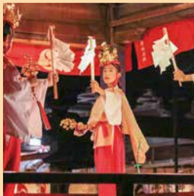
秋部門 (撮影地：酒屋神社 / 酒屋太々神楽)