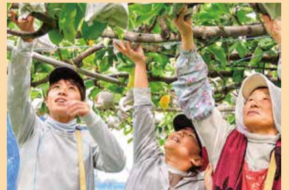
秋部門 (撮影地：割野 / 梨の収穫体験)