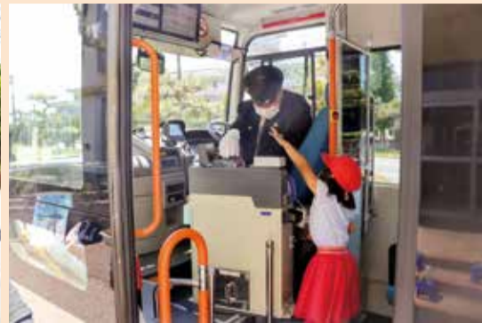
リ्यूーとで支払体験