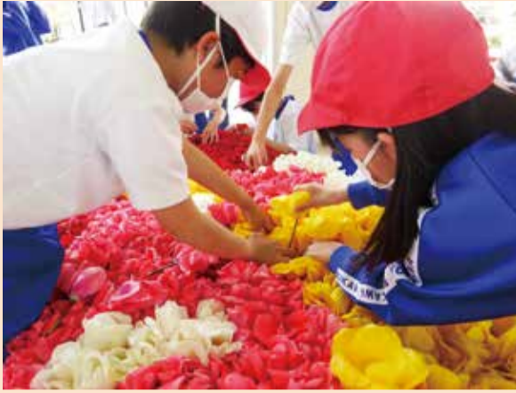
チューリップの花を挿す小学生

4月26日に両川地区青少年育成協議会が主催の花絵づくりが行われました。気持ちいい晴天の中、午前中は地域のボランティアが約8千本のチューリップの花を摘み、午後から両川小学校で2~6年生の生徒も参加し、花絵づくりを行いました。コロナ禍のため、3年ぶりの開催となったイベントでしたが、初めての子も経験者の子供たちや地域の人とともに楽しく花を挿しながら交流することができました。