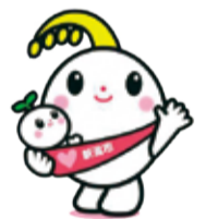
新潟市子育て応援キャラクター ほのわちゃん