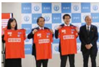
左から江南区長、南区長、新潟市長、中野社長