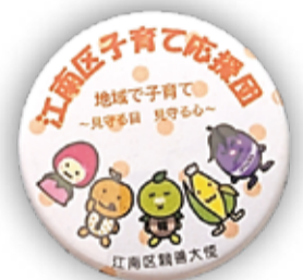
子育て応援団バッジ