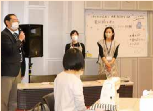
農作業着がルーツのため、生地は丈夫などといった亀田縞の紹介されました