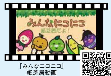
「みんなにこにこ」紙芝居動画