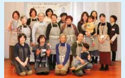
亀田縞エプロン作り