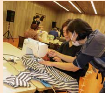
初心者でも簡単に素敵なエプロンを作ることが出来ました