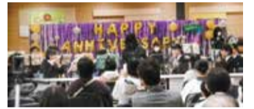
昨年の周年祭の様子