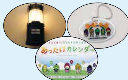
防犯防災グッズと助け合いカレンダー

また、地域で行われている助け合い活動を知ってもらうとともに、自分でもできることから始めてもらうきっかけづくりのため、区内の助け合い活動の事例を集めたカレンダーを作成し、配布しました。