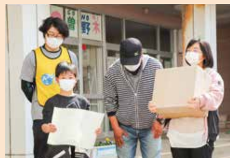
優勝チームに曾野木地区の名産品が詰まったスペシャルギフトを贈呈