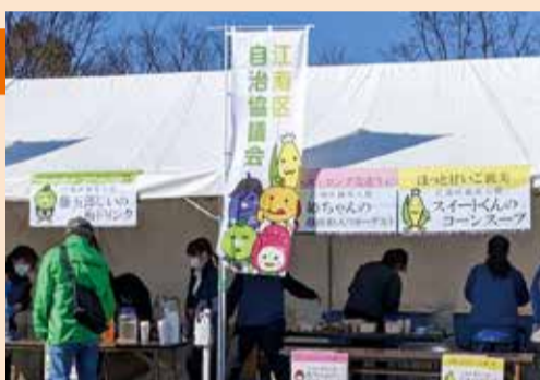
江南区の特産品を提供するふるまいブース

区の魅力と完走タイムを表示した撮影スポットでは、たくさんの人の笑顔が見られました。