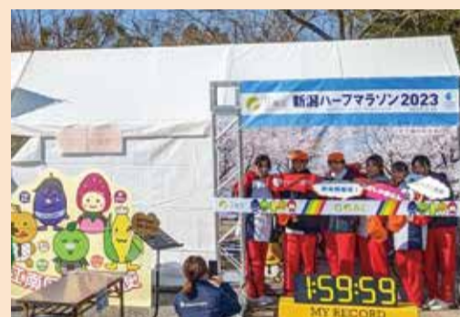
江南区の魅力が入った撮影スポット