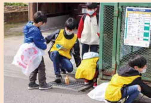
楽しくゴミ拾いをしている様子