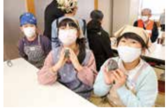
綺麗な形にできました