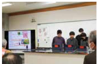
米作りにおける害虫・病気をテーマにした発表