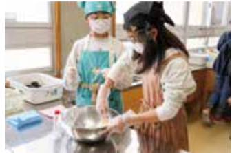
班員全員で協力しておにぎりを作りました